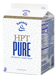
Gallon Weight: 8 lbs (3.6 kg)