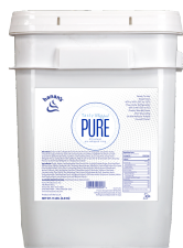
Pail Weight: 15 lbs (6.8 kg)